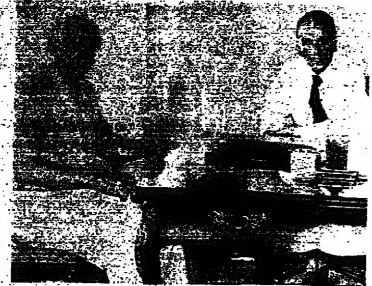
الرئيس شمعون اثناء اجتماعه مع الشيخ بيار الجميل

الرئيس اسعد محاطاً بالرئيسين سلام وكرامي في مكتب « هولدياي » امس